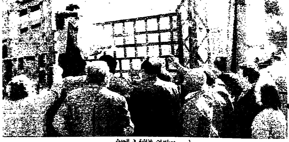
مساعدات غذائية في الحدث